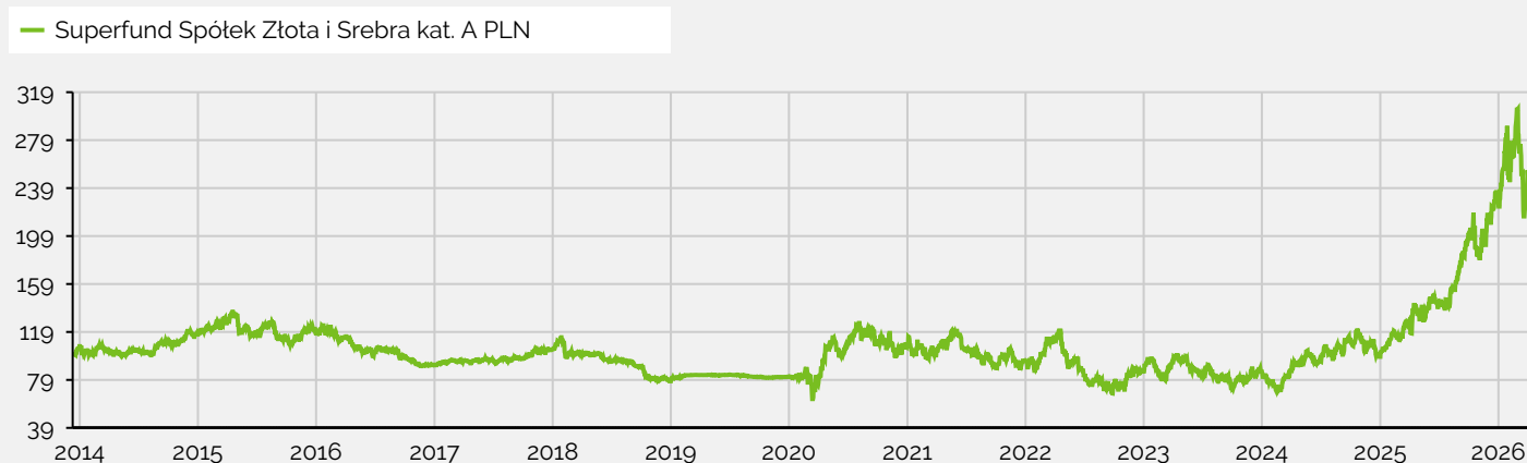
Wykres notowań od: 2013-12-10 do: 2026-04-30.