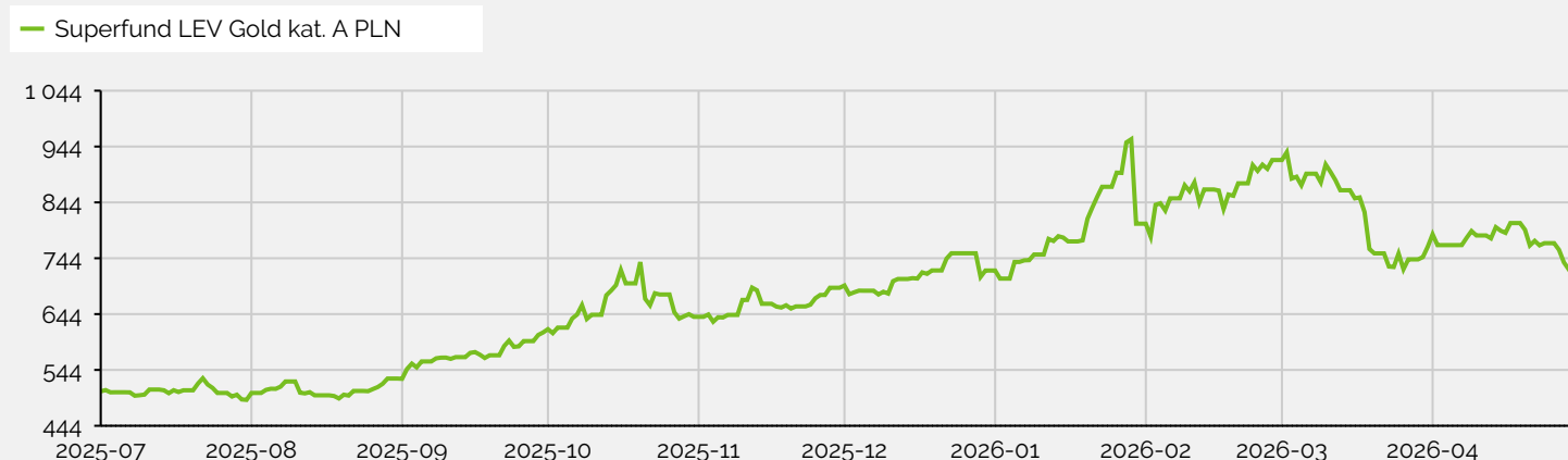
Wykres notowań od: 2025-07-01 do: 2026-04-30.