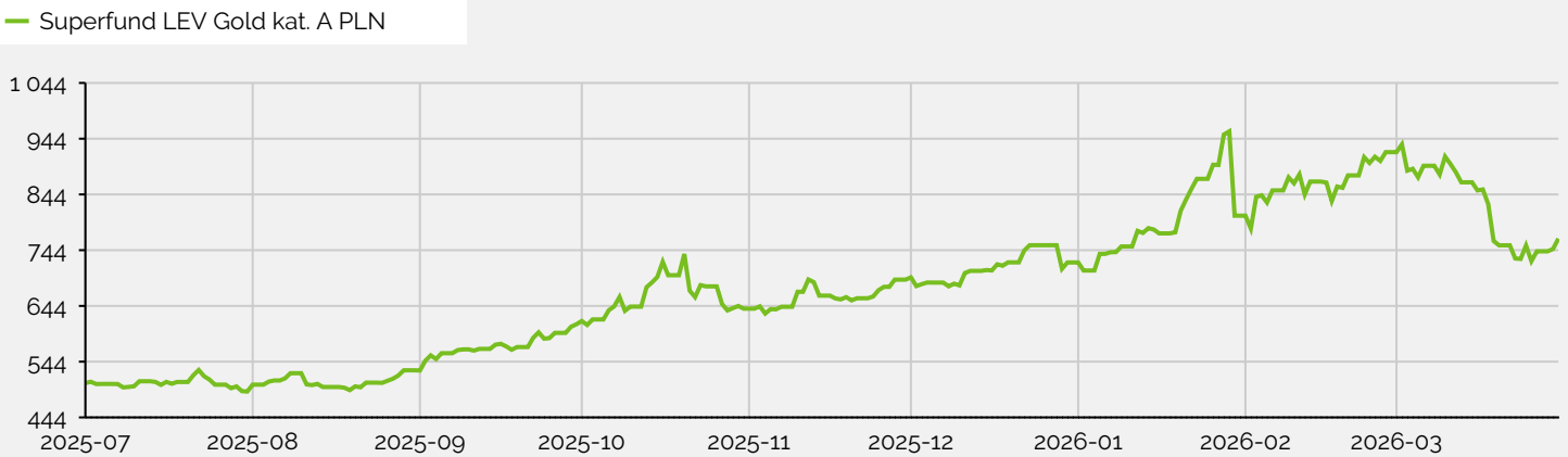
Wykres notowań od: 2025-07-01 do: 2026-03-31.