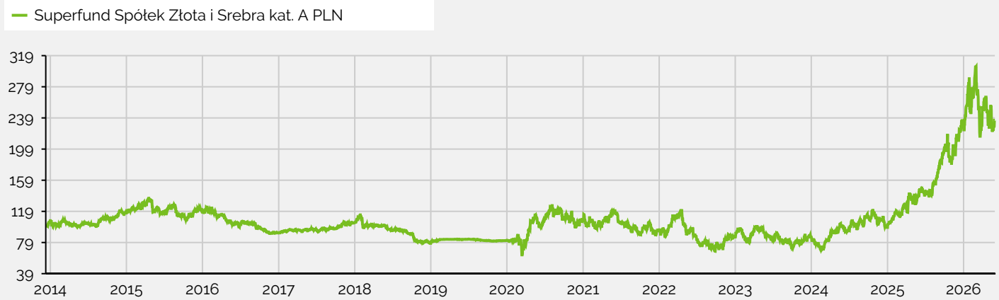
Wykres notowań od: 2013-12-10 do: 2026-05-31.