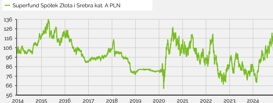
Wykres notowań od: 2013-12-10 do: 2024-11-30.