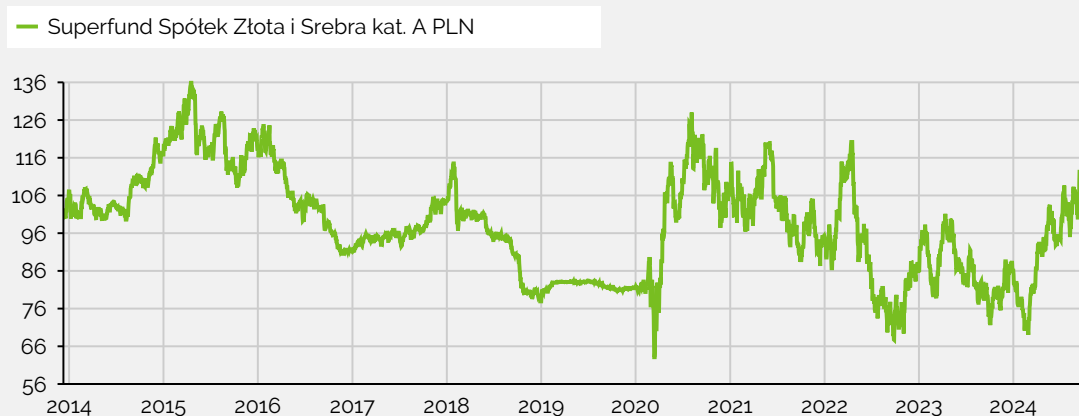
Wykres notowań od: 2013-12-10 do: 2024-09-30.