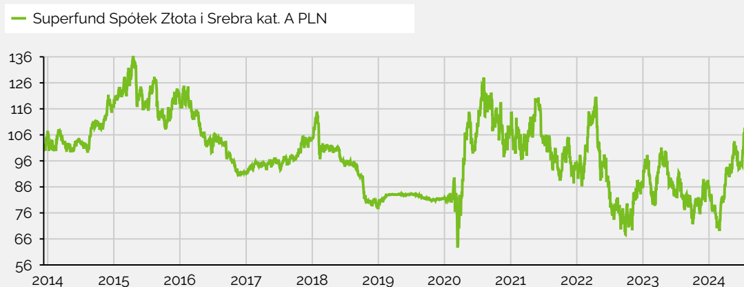
Wykres notowań od: 2013-12-10 do: 2024-07-31.