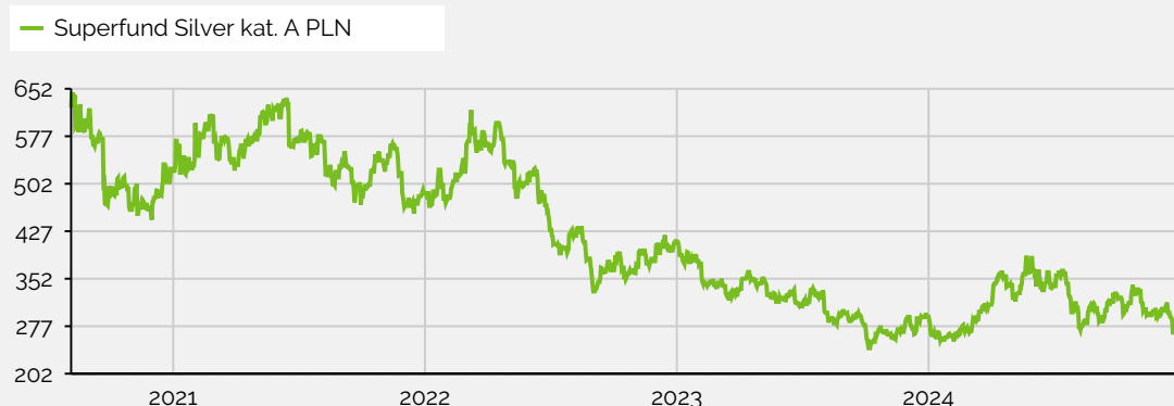
Wykres notowań od: 2020-08-06 do: 2024-12-31.