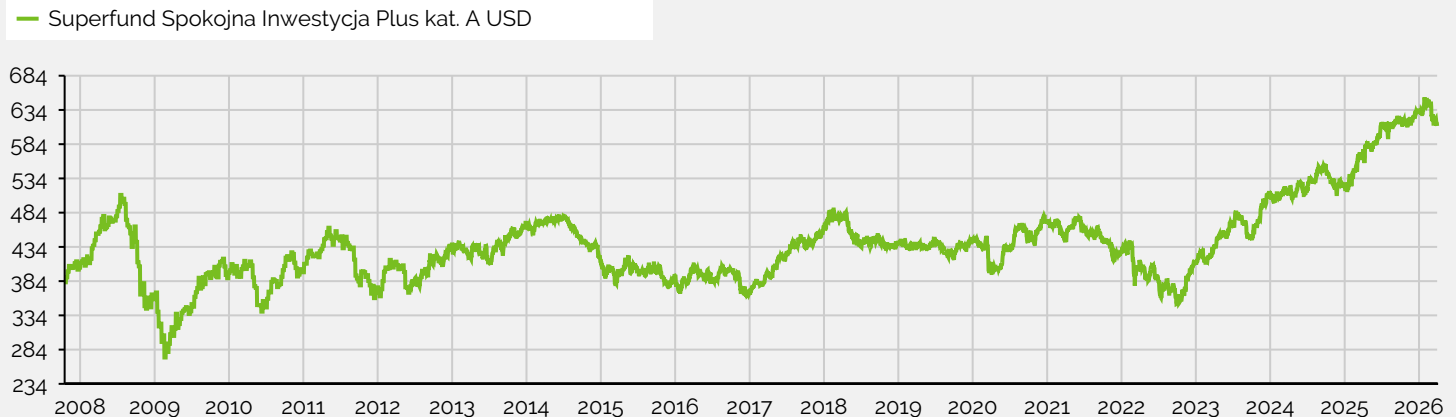
Wykres notowań od: 2007-10-17 do: 2026-03-31.