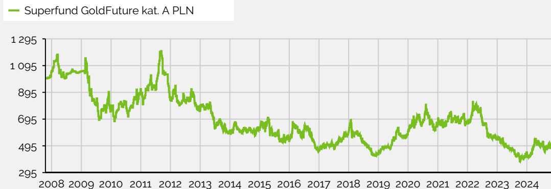
Wykres notowań od: 2007-10-17 do: 2024-11-30.