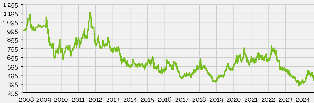
Wykres notowań od: 2007-10-17 do: 2024-09-30.