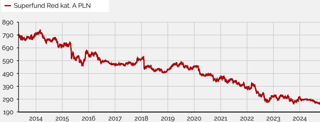
Wykres notowań od: 2013-05-06 do: 2024-10-31.